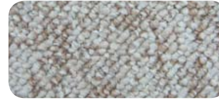
1998 Flax 1998 Lin