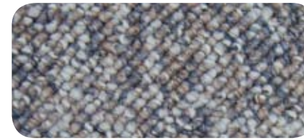
3773 Sandal 3773 Sandale