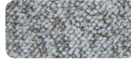
1990 Canvas 1990 Toile