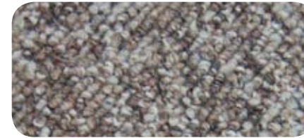
7061 Buckskin 7061 Peau de daim