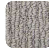
7076 Tea Rose 7076 Rose thé