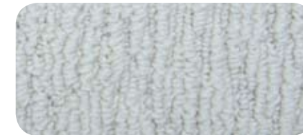
1465 Wool 1465 Laine