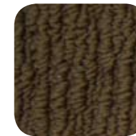
5380 Spicebush 5380 Buisson d'épice