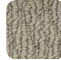
2280 Ginger 2280 Gingembre