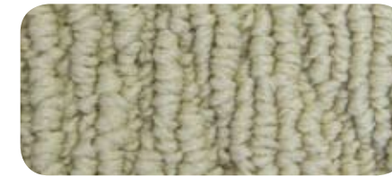
3565 Cetic Wool 3565 Laine Celtique

Venture 10 Year Anti-Static Guarantee Garantie anti-statique Venture de 10 ans