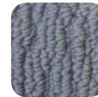
3490 Cobweb 3490 Toile