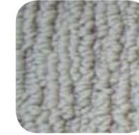
1470 Saracen 1470 Sarrazin