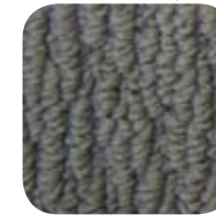
7480 Barrel 7480 Tonneau